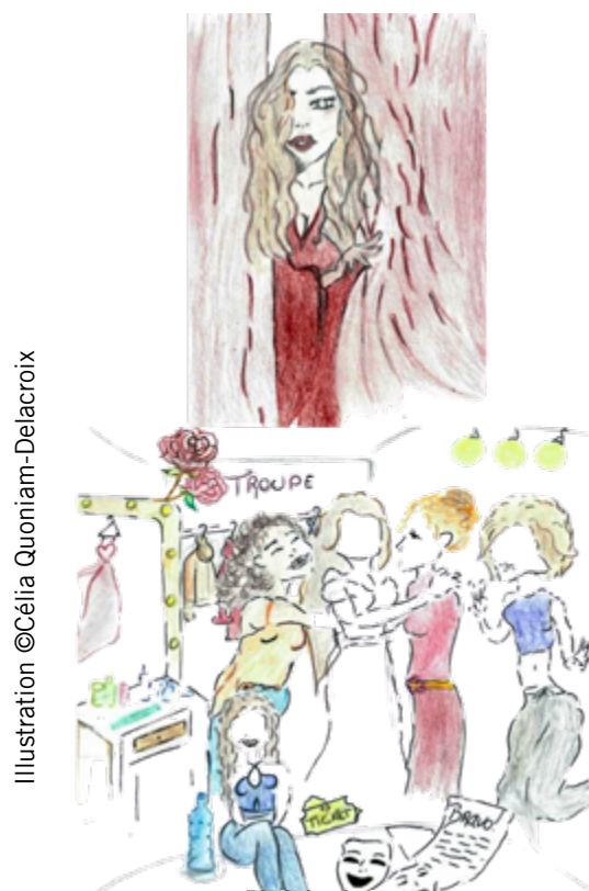
Illustration ©Célia Quoniam-Delacroix