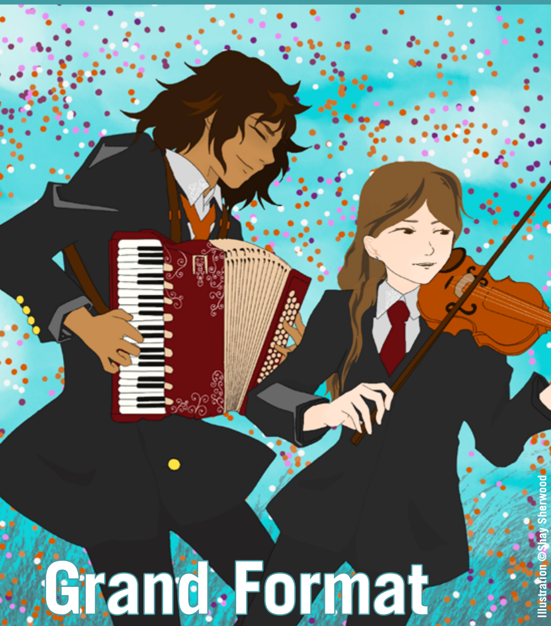
Illustration © Shay Sherwood

le journal des jeunes de la Mission Locale Lille Avenir