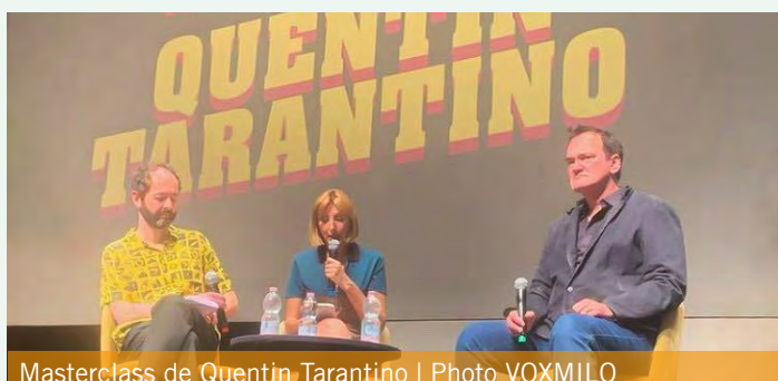
Masterclass de Quentin Tarantino