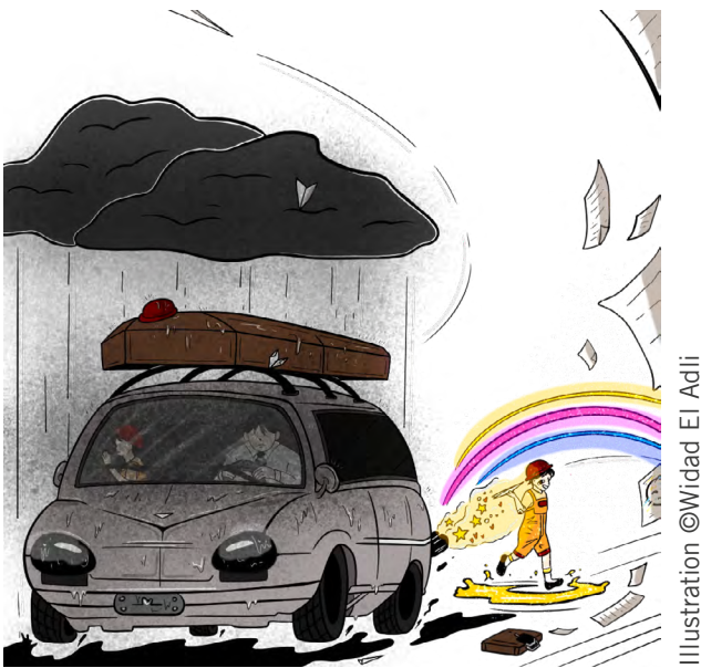
Illustration ©Widad El Adli

Triste adulte, sépulture d'un bambin qui n'est plus, Hantée par des rêves d'antan, tous avortés, Et par les ambitions d'une "grande personne" dépossédée, De son enfant intérieur qu'elle n'enterre pas, Cercueil ambulante, triste soldat.