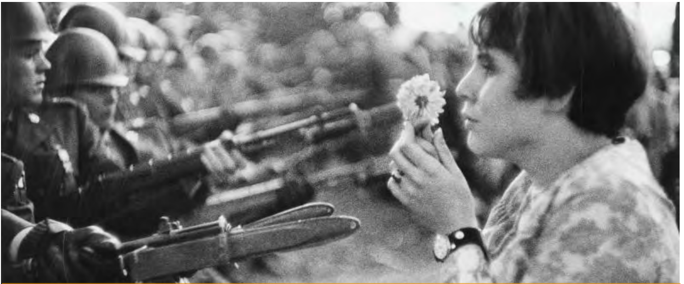
La jeune fille à la fleur