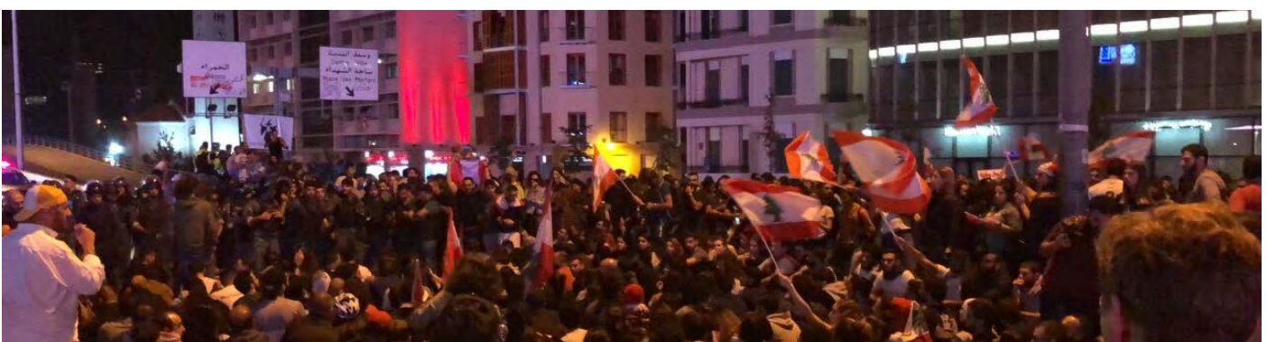
Manifestants libanais