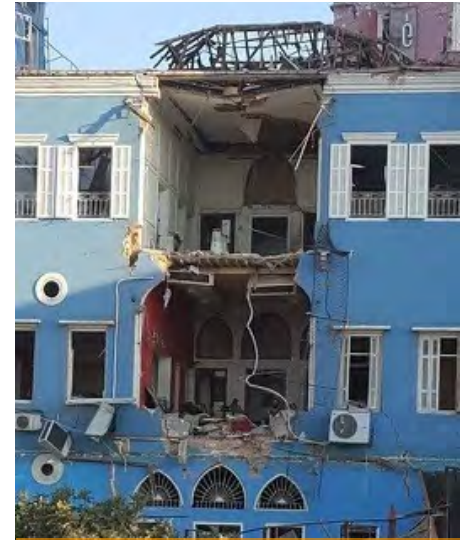
Immeuble de Beyrouth

l'investigation de l'explosion du port. Ces clashes entraînent 7 morts et 32 blessés.