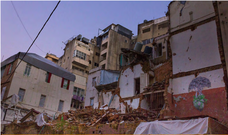
Immeuble détruit de Beyrouth