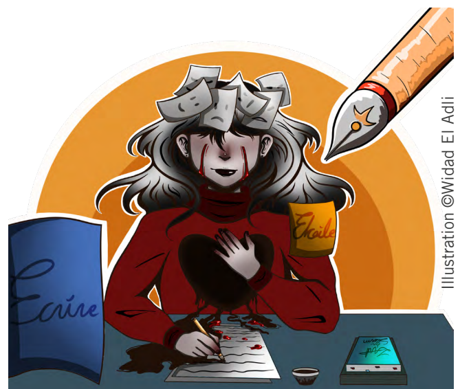
Illustration ©Widad El Adli