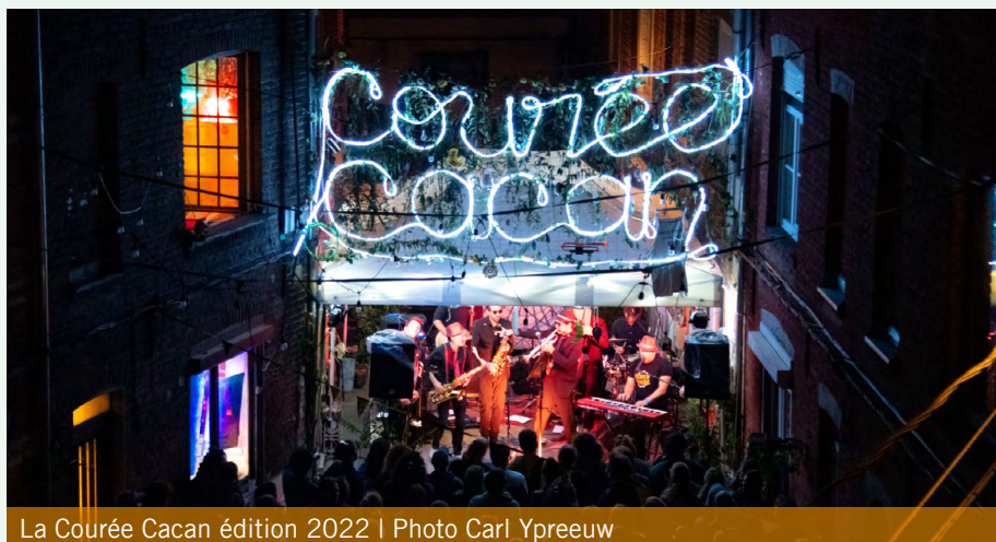
La Courée Cacan édition 2022

et interpersonnels dans la communauté locale. Les habitants pourront ainsi mieux se connaître, s'entraider et construire ensemble un quartier plus solidaire et plus uni