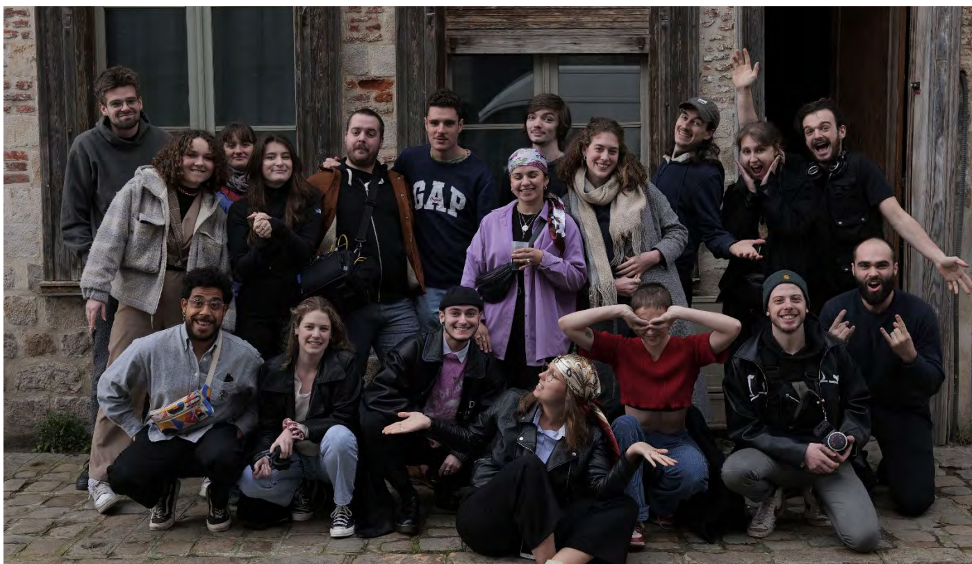
Membres de l'équipe