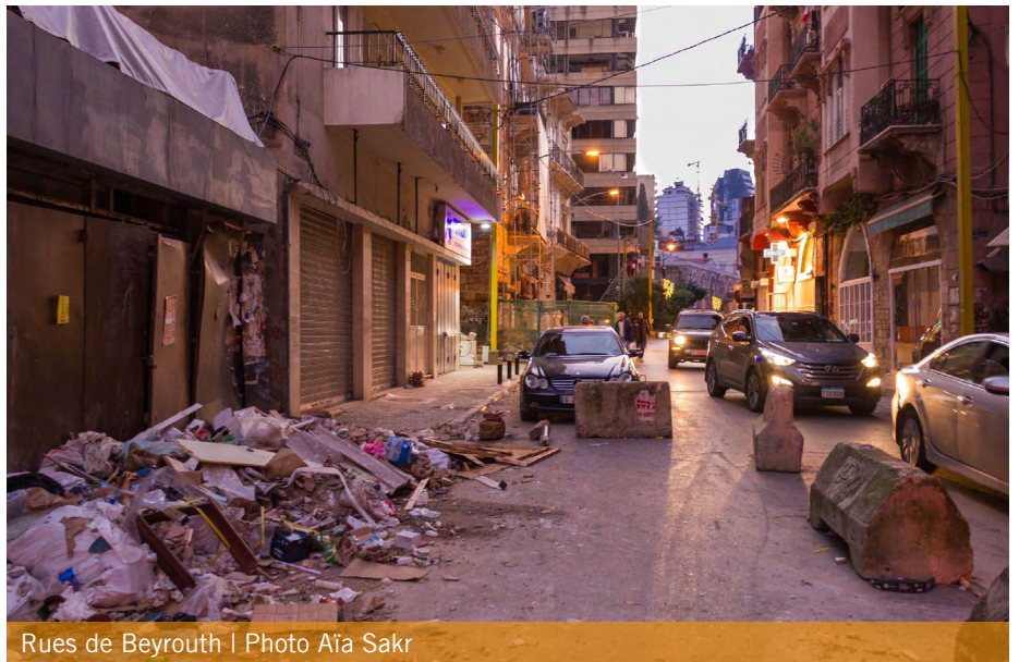
Rues de Beyrouth

Tandis que la population libanaise se mobilise sans