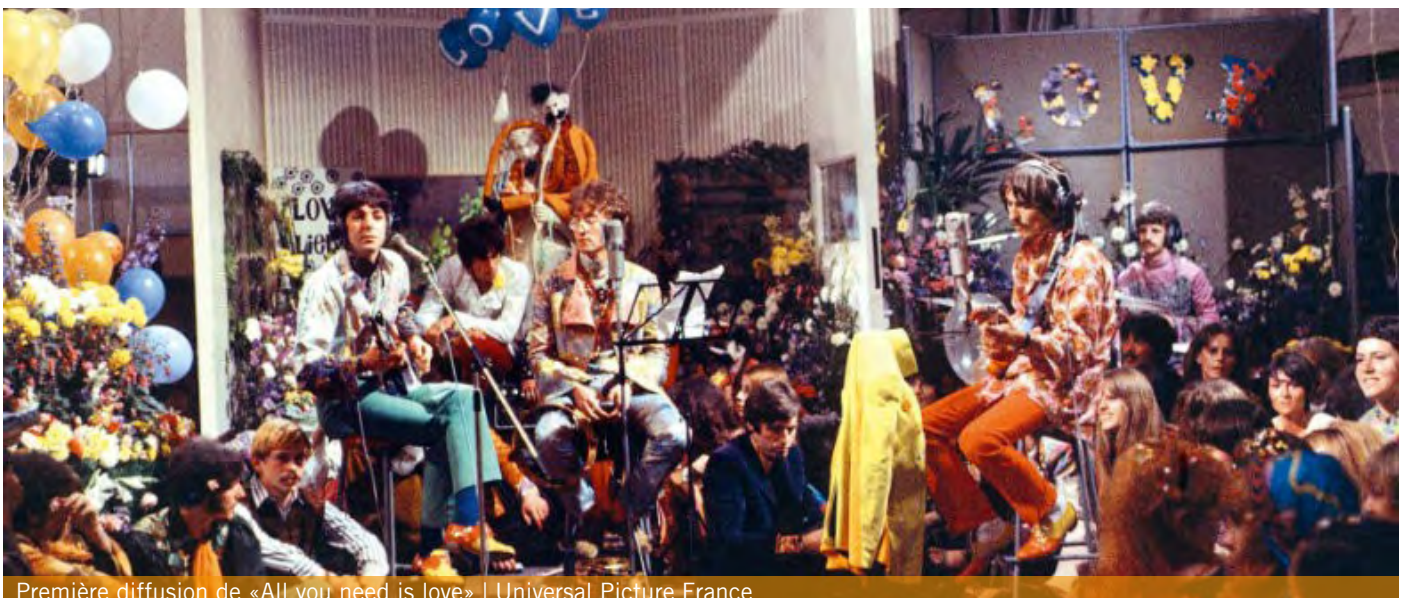
Première diffusion de «All you need is love»

On explore de nouveaux champs d'expérimentation. C'est dans le LSD, la toute nouvelle drogue à la mode, que la jeunesse