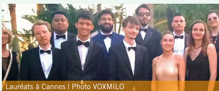
Lauréats à Cannes